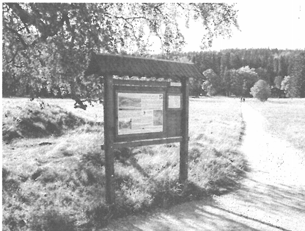
Nový informační panel.

kterých se objevují dosud nezveřejněné fotografie z rodinného archivu Schönburg-Waldenburgů ve Žluticích.